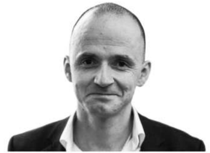
Олександр Лінчевський, заступник Міністра охорони здоров'я України

Використання в лікарській практиці нових клінічних настанов — один із найважливіших шляхів впровадження доказової медицини в нашій країні. 28 квітня 2017 набув чинності наказ МОЗ України від 29.12.2016 № 1422, який дозволяє українським лікарям