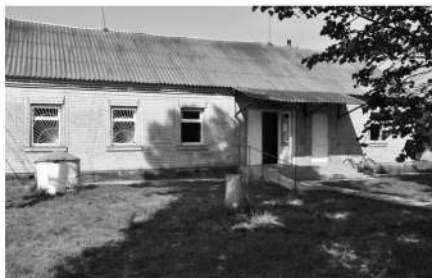
АЗПСМ у с. Полянка

Рекомендуємо дуже обережно і виважено підходити до питання придбання аналізаторів для ПМД з урахуванням видатків на витратні матеріали, кількості та спектру видів необхідних аналізів, утримання персоналу тощо. Зазвичай якісна організація логістики до центральної лабораторії може бути кращим рішенням. Крім того, як свідчить